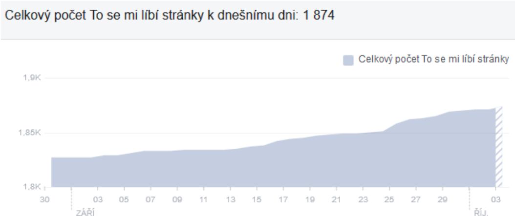
Postupný vývoj počtu fanoušků facebookové stránky Český svaz jachtingu

Celkový počet fanoušků se během září zvýšil z 1 827 na 1 874 lidí. Postupný vývoj počtu To se mi líbí můžeme sledovat v grafu.