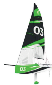
Day Boat Racer