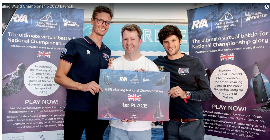
Národní mistrovství v eSailingu uspořádalo v loňském roce šest zemí. Mezi nimi byla i Velká Británie.

teli (celých 21 % hráčů účastnících se play-off reprezentovalo Francii), a proto není divu, že je francouzština jedním z oficiálních jazyků mistrovství. Ostatně to trochu kopíruje situaci ze skutečného světa námořního jachtingu.