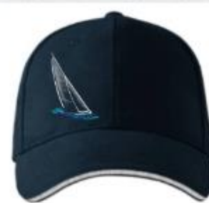
KŠILTOVKA ČSJ 374,00 Kč