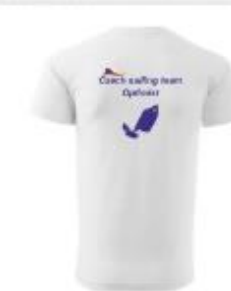
TRIČKO MALFINI KR. RUKÁV... 558,00 Kč