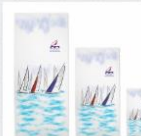
RYCHLESCHNOUČÍ RUČNÍK ČSJ 120,00 Kč