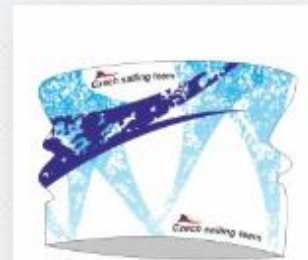
MULTIFUNKČNÍ ŠÁTEK 210,00 Kč