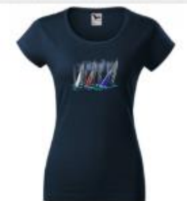
DÁMSKÉ TRIČKO KR. RUKÁV ČSJ 768,00 Kč