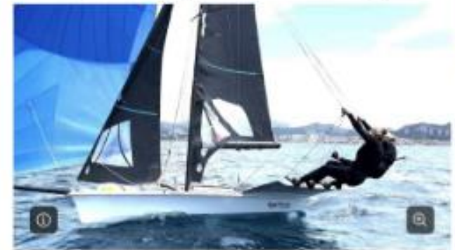
České olympijské jachtařky Zosia Burska a Sára Tkadlecová