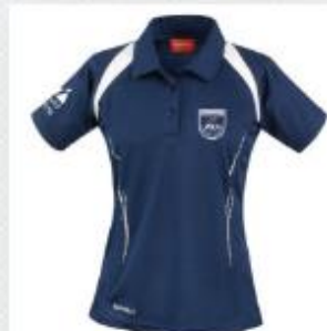
DÁMSKÉ POLOTRIČKO KR. RUKÁV... 750,00 Kč