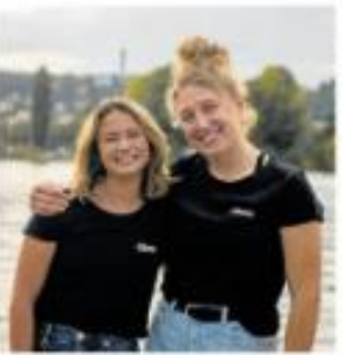
OLYMPIJSKÉ JACHTAŘKY ZOSIA BURSKA A SÁRA TKADLECOVÁ

Zosia Burska a Sára Tkadlecová jsou české olympijské jachtařky. Na posledních olympiádě v Tokiu se staly prvními českými jachtařkami, které získaly bronzovou medaili. V Paříži byly také prvními českými jachtařkami, které získaly bronzovou medaili. V Paříži byly také prvními českými jachtařkami, které získaly bronzovou medaili.