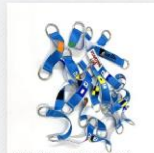
POŘADAČ VLAJEK 398,00 Kč