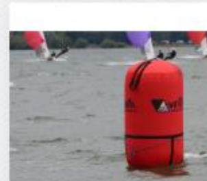
NAFUKOVACÍ BŮJE VÁLEČ 4 603,00 Kč